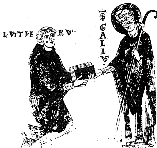
Der Mönch Lutherus widmet sein Gradualbuch dem heiligen Gallus. Aus dem Originalmanu- skript (XII. Jahrhundert) in der Stiftsbibliothek

Auf der Rückreise kann in Rorschach die Sankt Kolumbans-Pfarrkirche und in Arbon die Sankt Gallus-Kapelle besichtigt werden.